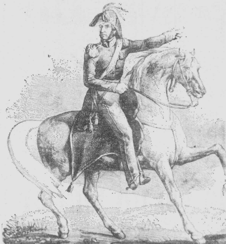
Litografía de San Martín, uno de los tres retratos que el artista francés Géricault hizo del vencedor de Maipo.

Prepara su expedición en Mendoza y allí construye el verdadero ejército de la Patria. Con in-