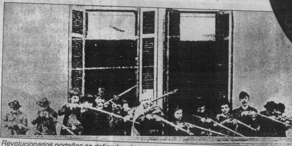
Revolucionarios porteños se defienden durante la revolución que derrocó a Juárez Celman.

Sus dos años en el gobierno fueron el reflejo de la crisis política y económica que demostró que el "orden y progreso" no lo eran tanto