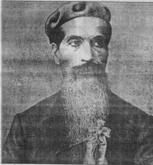
Leandro N. Alem, nuevo líder que dejó la revolución del '90.