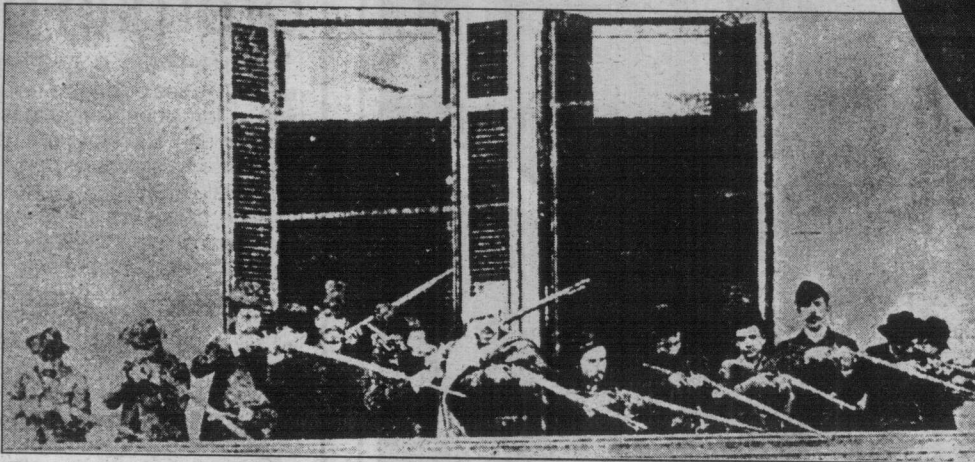
Revolucionarios porteños se defienden durante la revolución que derrocó a Juárez Celman.

Sus dos años en el gobierno fueron el reflejo de la crisis política y económica que demostró que el "orden y progreso" no lo eran tanto