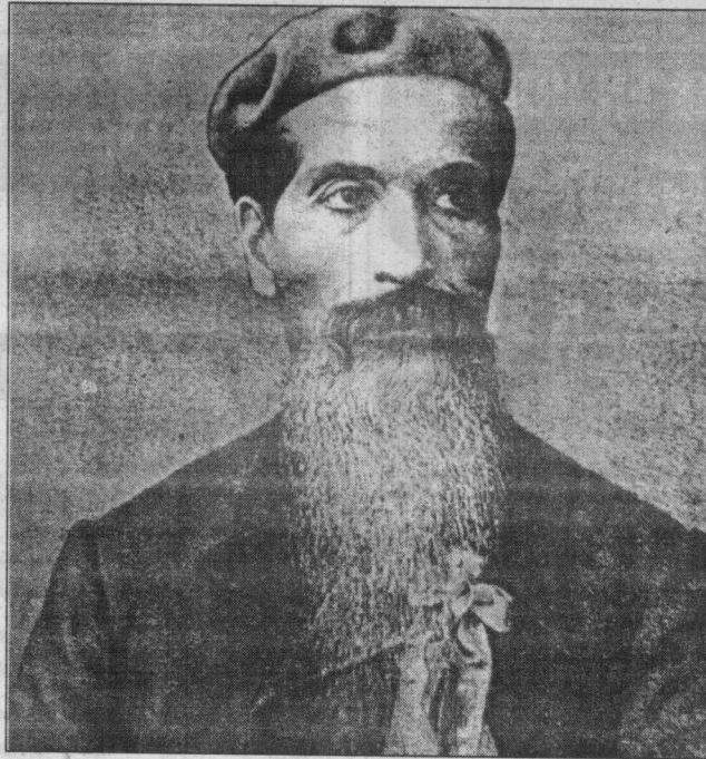
Leandro N. Alem, nuevo líder que dejó la revolución del '90.