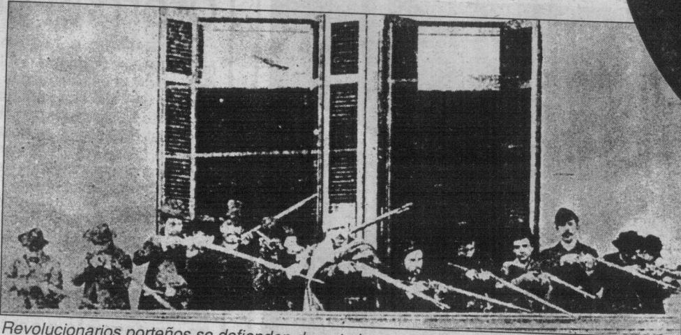
Revolucionarios portenyes se defienden durante la revolución que derrocó a Juárez Celman.

Sus dos años en el gobierno fueron el reflejo de la crisis política y económica que demostró que el "orden y progreso" no lo eran tanto