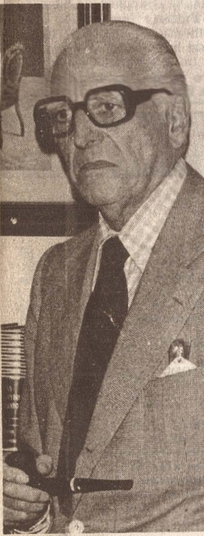
El autor del presente artículo.