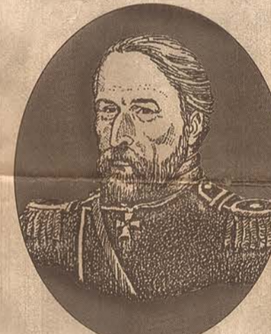
Benigno Villanueva . Alcanzó el rango de mariscal en la Rusia de los zares, adaptando su apellido al de Villanokoff , en 1857