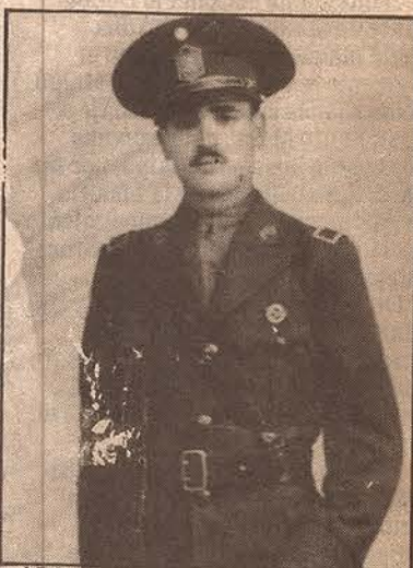
El conocido historiador mendocino con el uniforme de la Policía de Frontera, en una fotografía tomada en 1934.