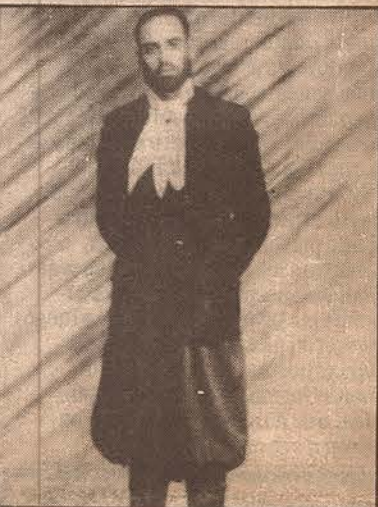
Cuando era oficial de la policía, luego de regresar de una comisión a la zona de Yalguaraz, donde permaneció cinco meses.