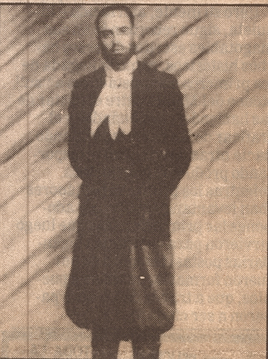
Cuando era oficial de la policía, luego de regresar de una comisión a la zona de Yalguaraz, donde permaneció cinco meses.