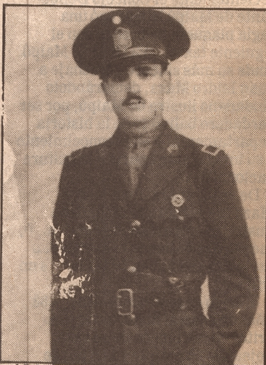
El conocido historiador mendocino con el uniforme de la Policía de Frontera, en una fotografía tomada en 1934.