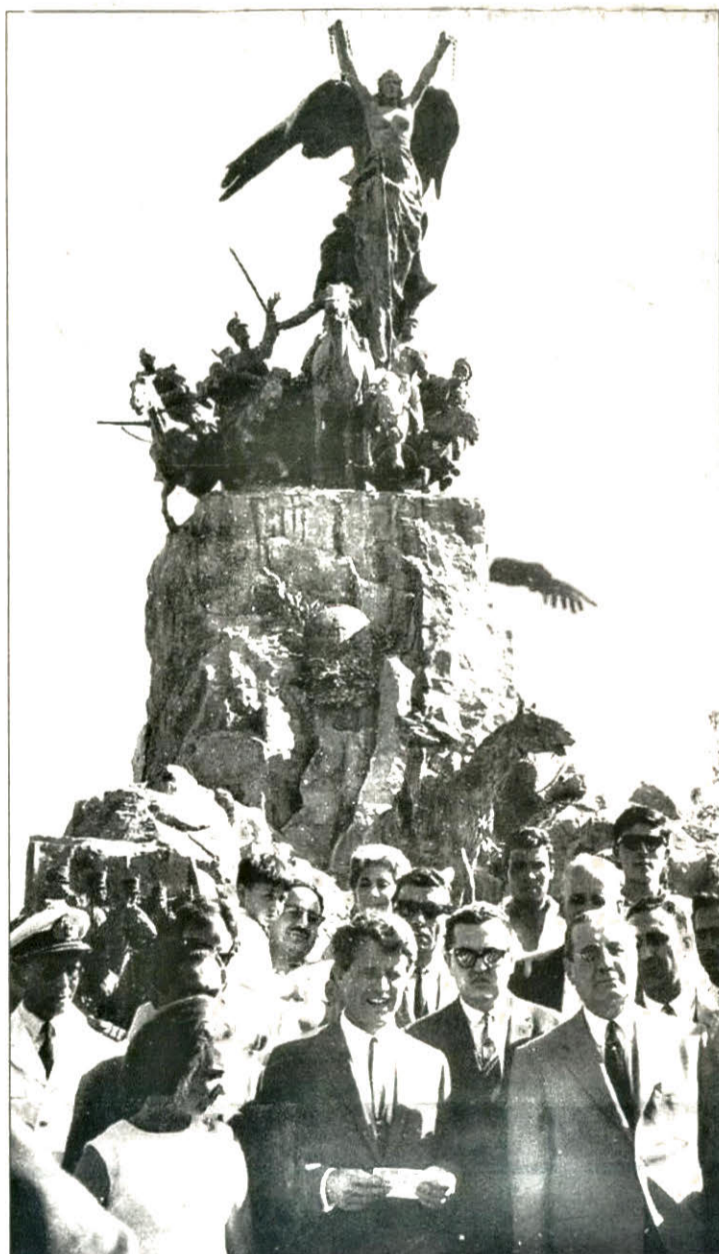
Robert Kennedy en el Cerro de la Gloria.

el senador por Massachusetts habló de la personalidad del General San Martín y de su campaña.