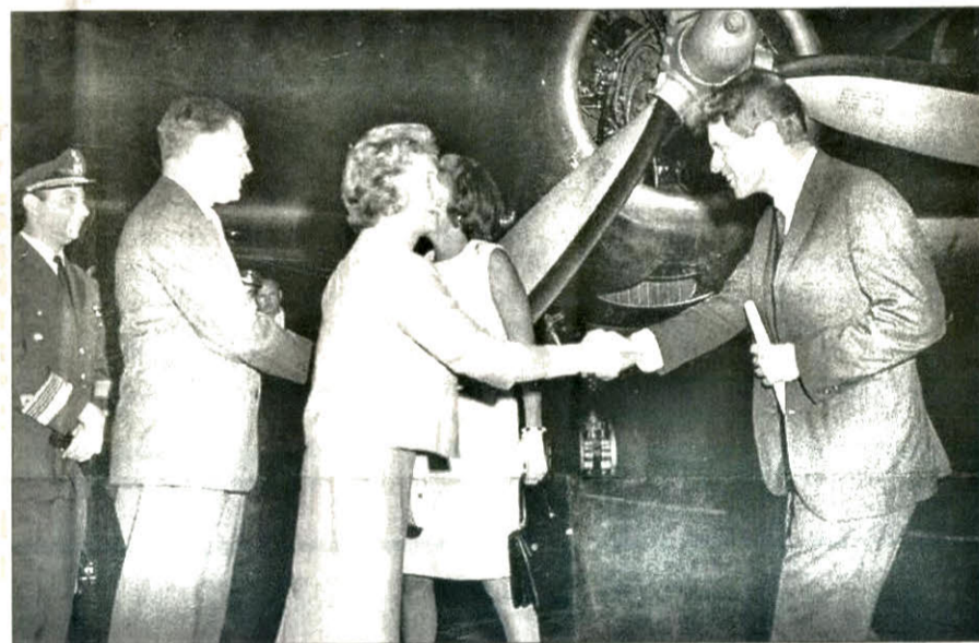
La pareja Kennedy es recibida por el embajador de EEUU en el aeropuerto metropolitano.

do la Argentina en varias ocasiones, ya que era productor de filmes mudos. Cuando tenía 19 años, abandonó sus estudios en la Universidad de Harvard para servir en la Marina de Estados Unidos, durante la Segunda Guerra Mundial. Cuando finalizó la guerra, regresó a la universidad y cursó estudios en las universidades de Harvard y Virginia. Cuando su hermano John comenzaba la carrera política, Robert fue fiscal de la sección criminal del Departamento de Justicia, cargo que abandonó en 1952 para dirigir la campaña de senador de su hermano. Tras la campaña, regresó al servicio gubernamental como consejero de la Comisión Moover. En 1960, su hermano mayor John, fue elegido presidente. Éste ocupó la fiscalía general. Su permanencia en