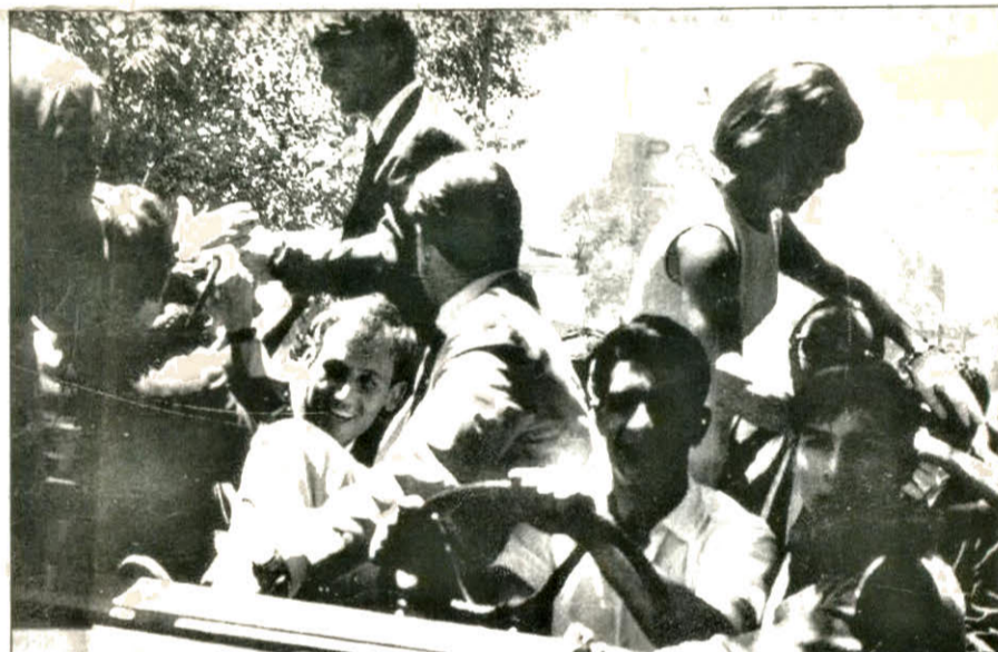
El matrimonio Kennedy saludando a los mendocinos en avenida San Martín.