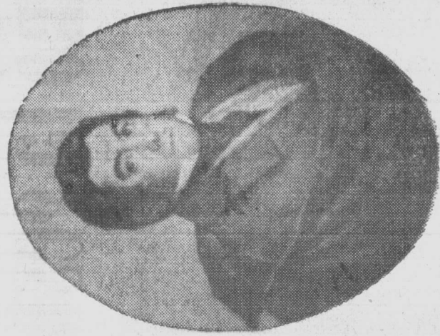
A los cincuenta años cumplidos y envuelto en una capa española, lo retrató Jean Baptiste Madou.