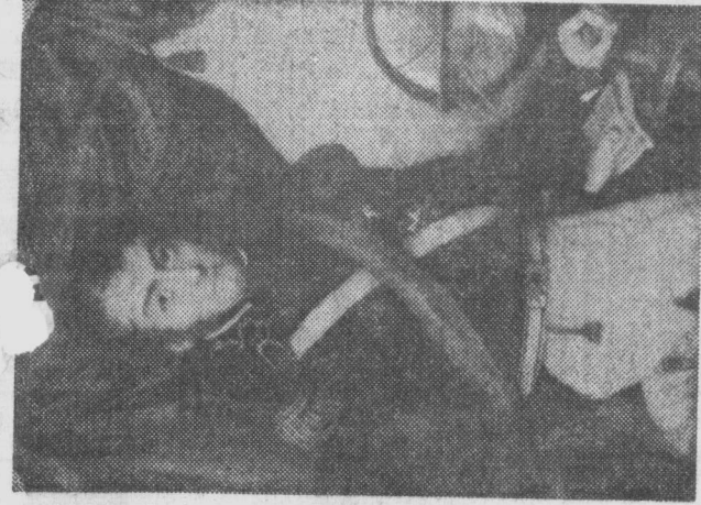
La miniatura de Wheeler muestra al Libertador condecorado con la Orden del Sol del Perú.