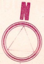
DIBUJO: C.F. BORDON