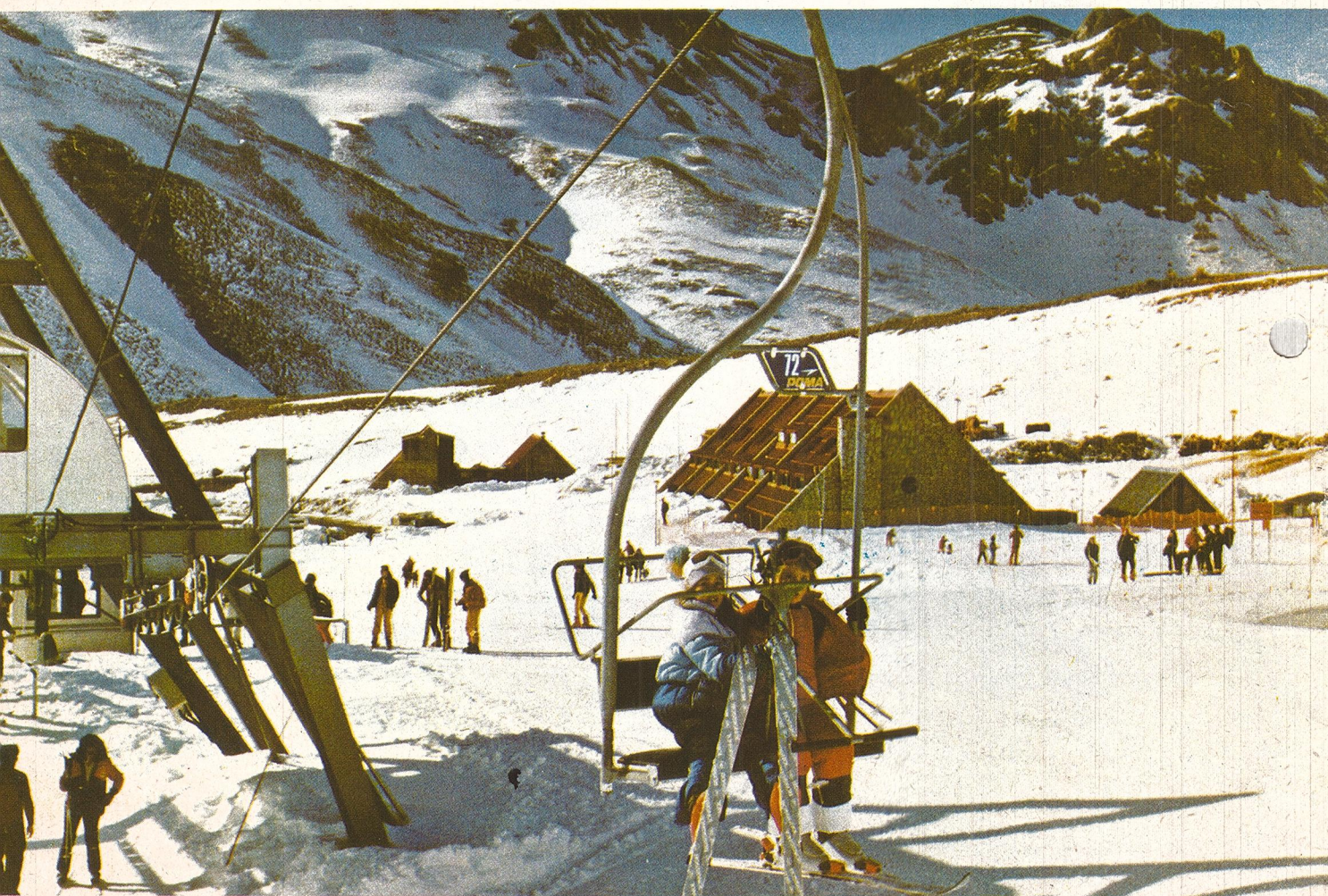
Salida de la telesilla Venus, en la Base.

Las circunstancias de crisis en que vive la provincia, no son un freno para que el impulso creador de los mendocinos recomponga su economía a poco que se le brinden las condiciones que se están reclamando al renacer de nuevas y deseadas esperanzas.