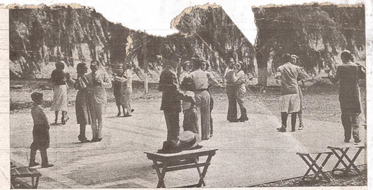
EQUITACION Y BAILE