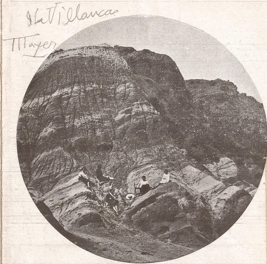
CERRO 7 COLORES

Cuidando su salud, ahorra dinero . Las preocupaciones y tareas diarias debilitan su sistema nervioso y agotan sus energías. Tómese unos días de descanso cambiando de clima y panoramas y tonificará su organismo. ELIJA con inteligencia el lugar más conveniente donde pasar sus vacaciones. Busque en las ALTAS MONTAÑAS SU SALUD , acumule energías respirando el AIRE PURO Y SECO de la montaña y si esto lo consigue con poco dinero, habrá realizado un buen negocio. Pase unos días en plena CORDILLERA , sentirá renovarse su vitalidad y rendirá más el trabajo.