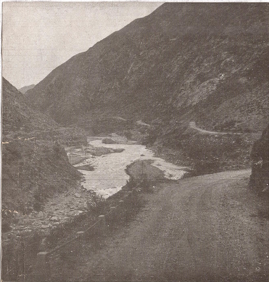
CAMINO A POTRERILLOS