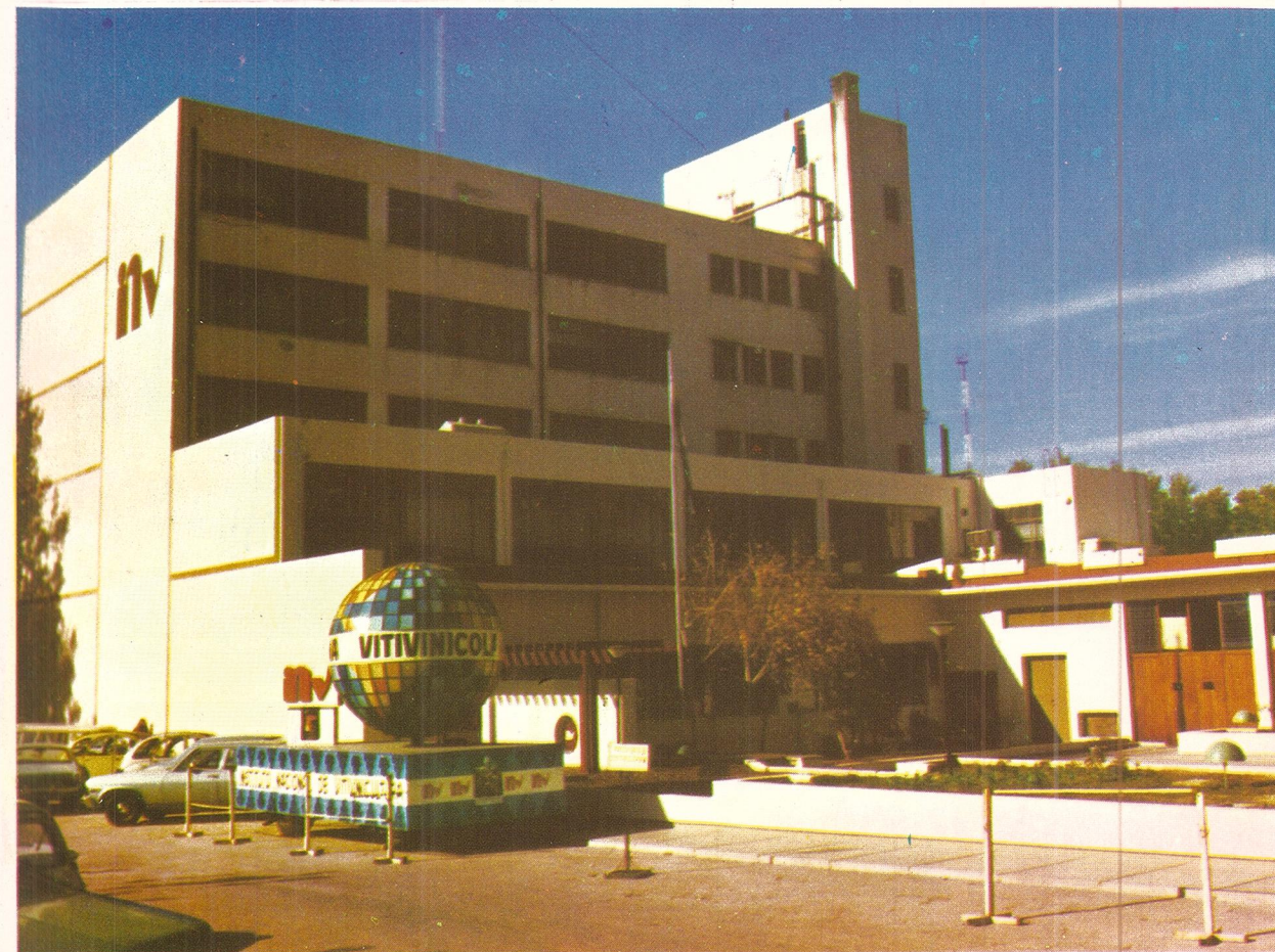
Edificio de l'Instituto Nacional de Vitivinicultura.

Médaille d'Or et Diplôme d'Honneur Médaille d'Argent et Diplôme d'Honneur Médaille d'Or et Diplôme d'Honneur Médaille d'Argent et Diplôme d'Honneur Médaille d'Or et Diplôme d'Honneur Médaille d'Or et Diplôme d'Honneur Médaille d'Or et Diplôme d'Honneur Médaille d'Argent et Diplôme d'Honneur