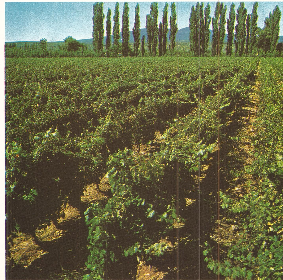
Vignoble (en treille et irrigation.)