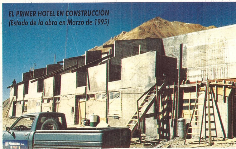
EL PRIMER HOTEL EN CONSTRUCCIÓN (Estado de la obra en Marzo de 1995)