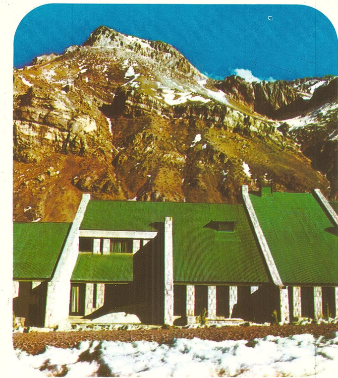
HOSTERIA PUENTE DEL INCA