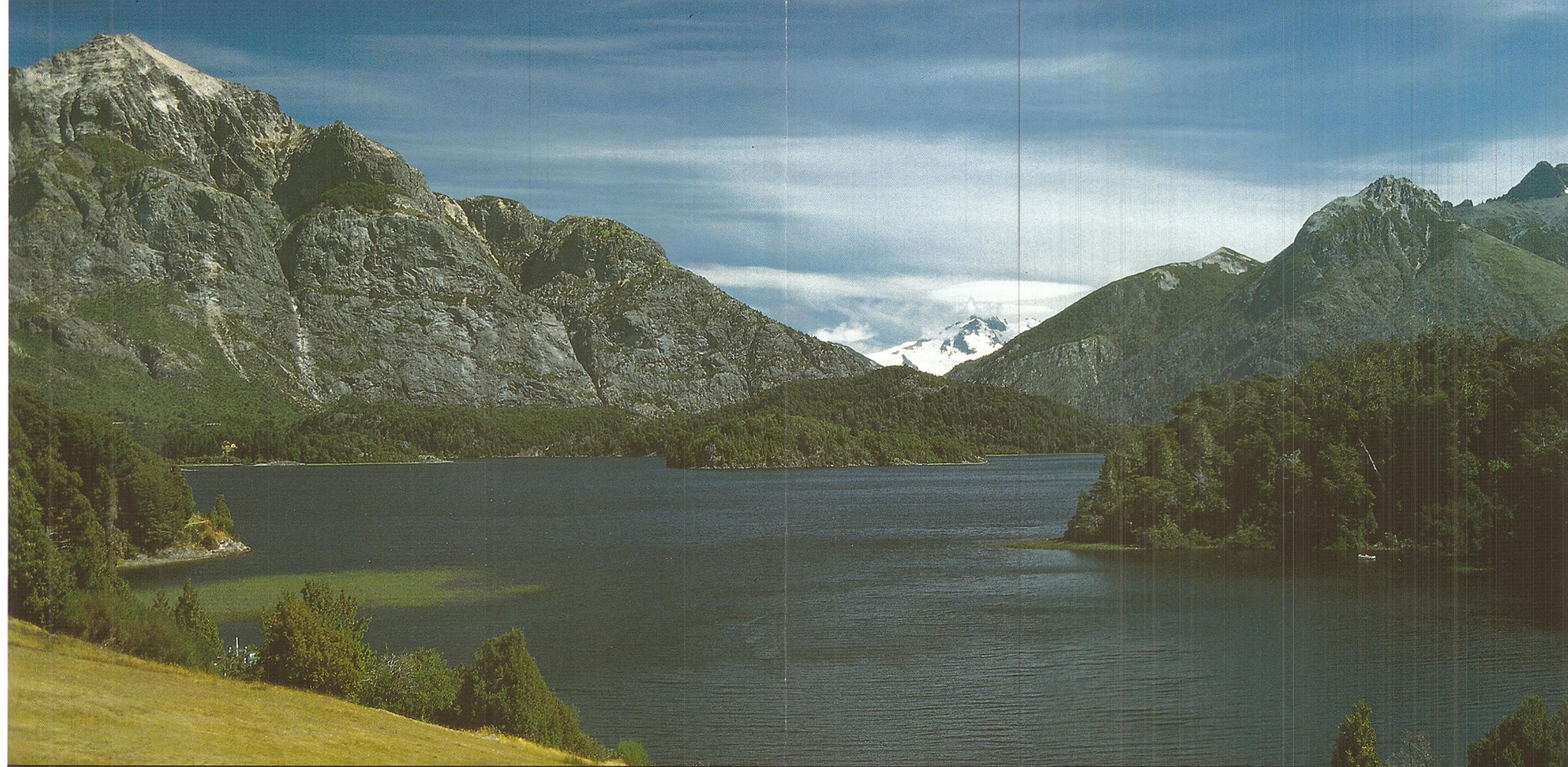
El Valle Hermoso. Su propio nombre lo describe

QUÉ COMPRAR. TEJIDOS. Fajas, chalinas, chalets, mantas y colchas. TALABARTERÍA. Pellones y cojines de cuero de oveja. ARTESANÍA. En