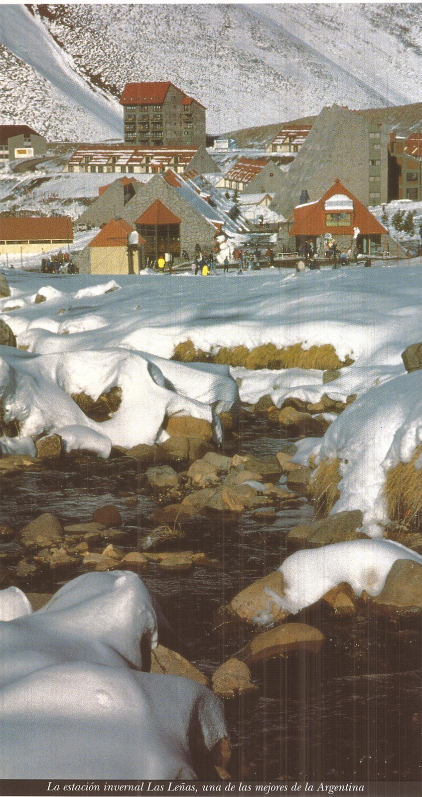
La estación invernal Las Leñas, una de las mejores de la Argentina

SECRETARÍA DE TURISMO PRESIDENCIA DE LA NACIÓN