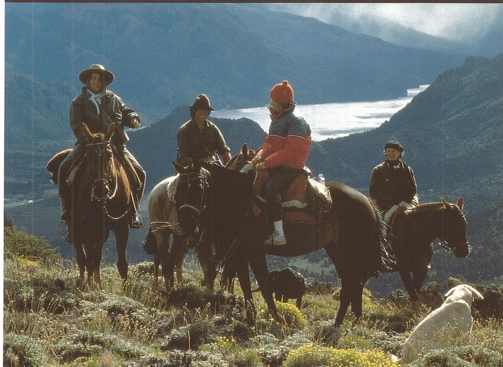
Una excursión a caballo por las inmediaciones del Aconcagua