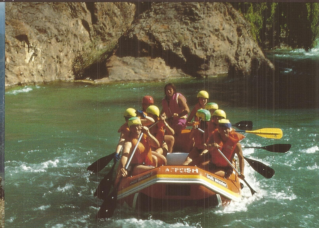
¡Aventúrese practicando rafting en los ríos de Mendoza!

fibra vegetal, en Guanacache: cestos y canastas de junquillo, revestidos con adornos de lanas de colores.